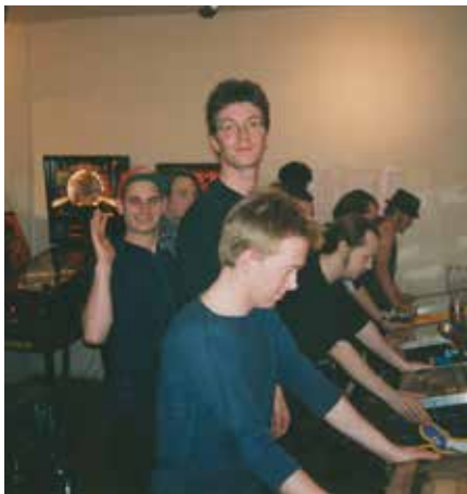
Personalfest på flippercaféet