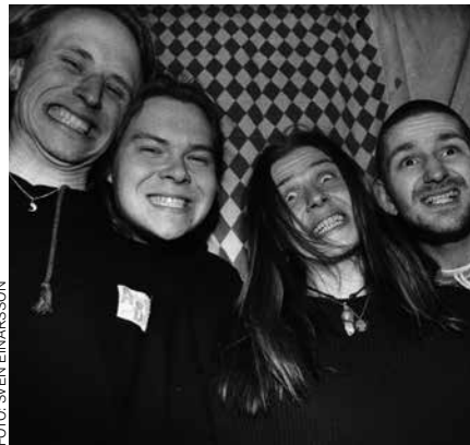
Svart Snö, 1994

minska då. Det här har ju alltid varit en hobby för oss. Det ska vara roligt. Det blir konstigt på nåt vis när andra människor blir beroende av att vi gör vår hobby och lite så kändes det ibland när det var som störst.