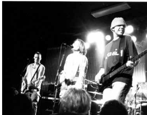
Åka Bil, Kolingsborg, 1994